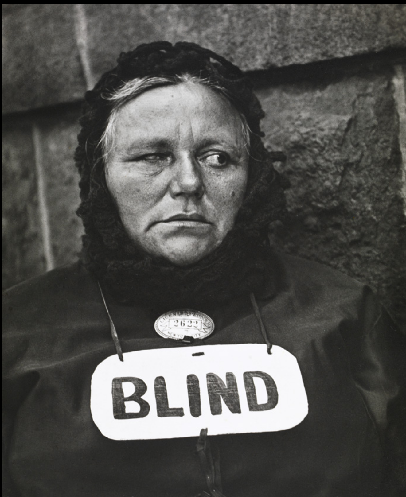
Paul Strand. Dona cega Nova York, 1916